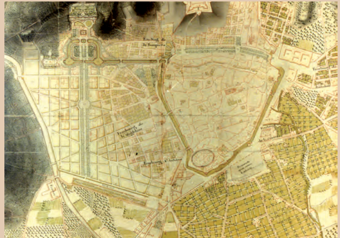
Plan Mareschal vers 1775 - Musée du Vieux Nîmes

● Après le bassin on prendra l'escalier à gauche. Face au Mas Rouge, il faut aller sur le petit belvédère (10) et admirer la vue. De là on embrasse du regard l'axe central du jardin et son prolongement au-delà de la grille d'entrée sur l'avenue Jean Jaurès. Le tracé de cette grande artère nord-sud et les quartiers attenants, figurent dans le projet de Mareschal en 1749. En effet, au delà du projet d'embellissement du site de la fontaine, c'est un plan d'extension de la ville, alors confinée à l'intérieur de ses remparts médiévaux et désireuse d'ordonner le développement des faubourgs, qui lui a été commandé. Le long des quais du canal de la Fontaine il conçoit un nouveau quartier d'hôtels particuliers qui ne seront construits qu'après la Révolution. Le Cours Neuf, actuelle avenue Jean Jaurès, est, quant à lui, réalisé par tronçons successifs au cours des XIX ème et XX ème siècles.