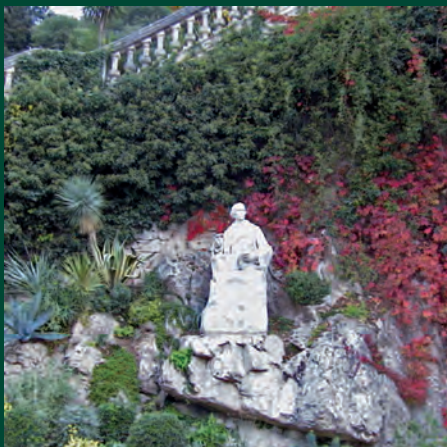
La statue d'Antoine Bigot

● En descendant les marches on passe devant le buste du poète nîmois, Antoine Bigot.