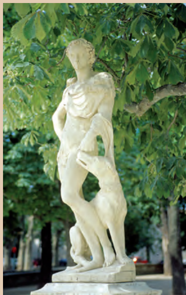
La statue d'Endymion

● Après avoir franchi le canal et la grille de l'entrée principale, on avancera juste de quelques mètres, jusqu'aux statues de Pan et d'Endymion (1) d'où l'on considérera l'ensemble des jardins de la Fontaine.