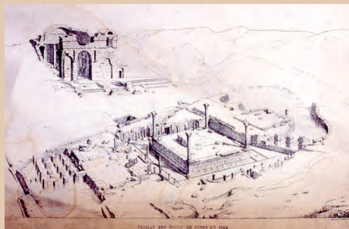
Fouille des bains de Nîmes en 1742