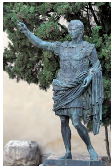
Porte Auguste à Nîmes. Copie de la statue d'Auguste de Prima Porta à Rome.

Octave, fils adoptif de César, devient le seul maître de Rome après la victoire d'Actium sur son rival Marc Antoine en 31 avant J.-C. Il a l'habileté politique de maintenir l'apparence des institutions républicaines. Le Sénat lui décerne le titre d'Auguste en 27 avant J.-C., nom qu'il conserve pour la postérité.