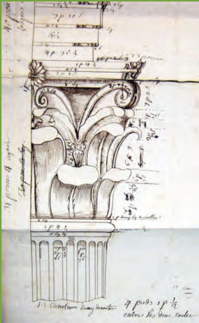
Dessin d'un chapiteau de la Maison Carrée attribué à Pierre Dardailhon, 18e siècle. Collection Bibliothèque Municipale Carrée d'Art, Nîmes.

Les chapiteaux ainsi que l'ensemble du décor appartiennent à l'ordre corinthien utilisé à Rome pour les temples dès la fin du II e siècle avant J.-C.