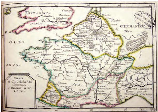
Carte de la guerre des Gaules dédiée à Nicolas Lamoignon de Basville, 1677. Collection Archives Départementales du Gard.