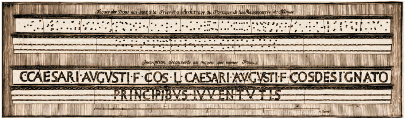
Dédicace restituée par le savant nîmois Jean-François Séguier en 1758 à partir des trous de scellement des lettres en bronze disparues. (Collection Musée du Vieux Nîmes)